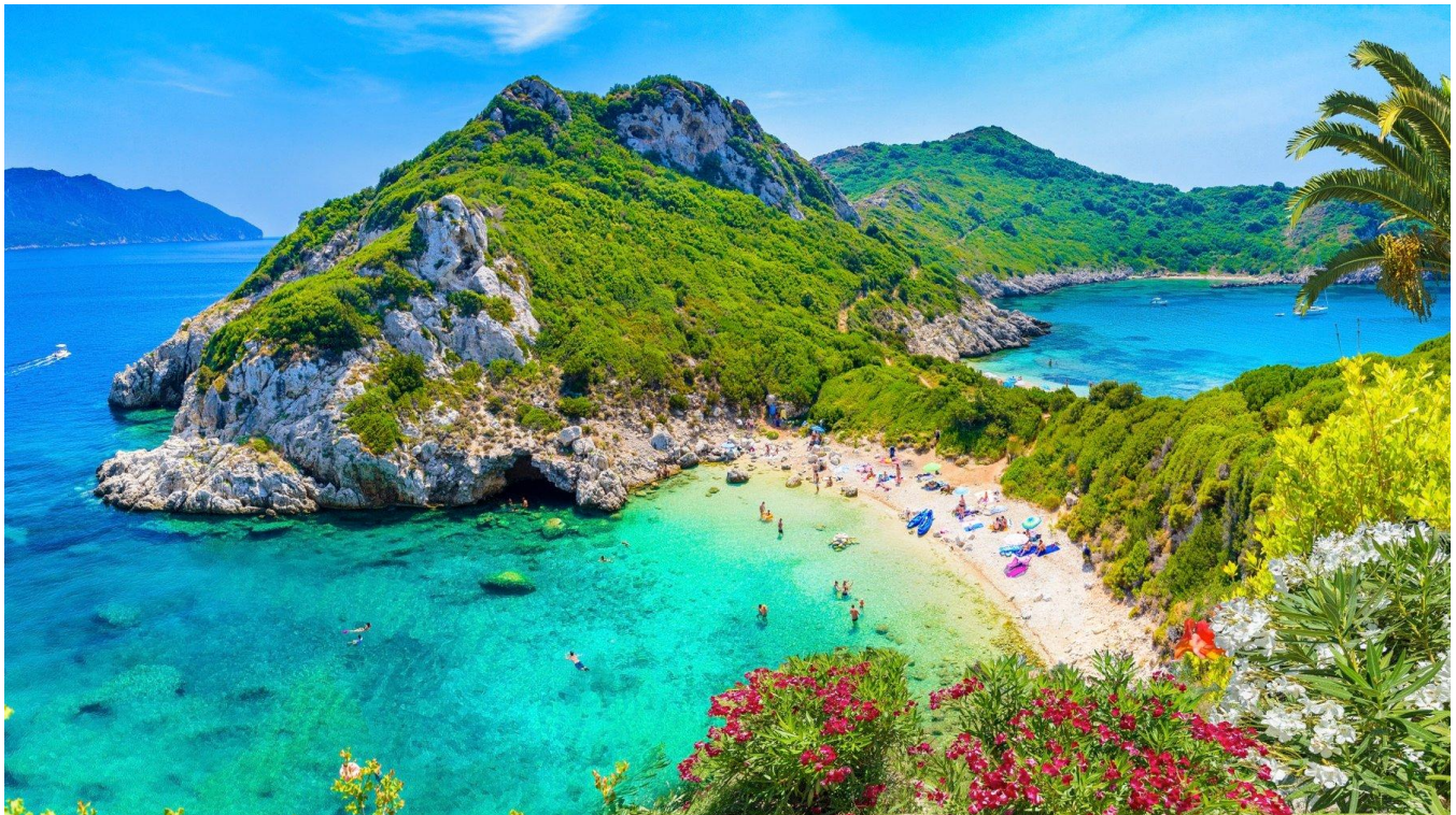
Ons besoek die skilderagtige Corfu-eiland op 13 Oktober

Nedbank: 119 1533 964 Tak: George Takkode: 198 765 Rekeninghouer: Van Dyk Travel Tipe rekening: Lopende/Besigheids Verwysing: GRC/ en u van Kontak die toerleier, Gerhard van Dyk , vir enige verdere navrae: Tel nr: 082 767 8400 Faks nr: 086 733 8987 E-pos: info@vandyktours.co.za