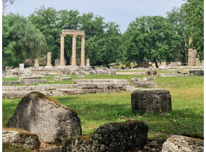
Besoek die argeologiese gebied waar die eerste Olimpiese Spele plaasgevind het.