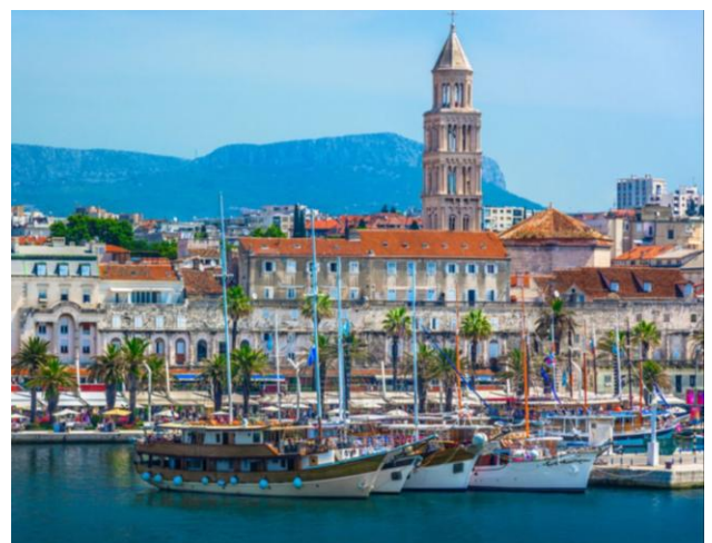
Split in Kroasië