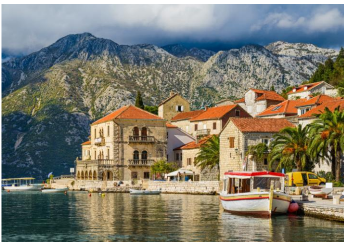
Kotor in Montenegro