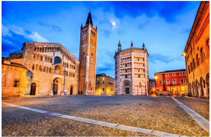
Die UNESCO-gebied in Ravenna in Noord-Italië