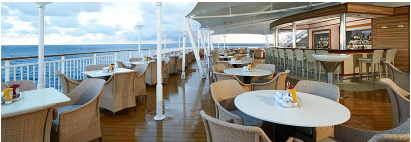
Ontspan by die Norwegian Gem se Great Outdoors Bar & Restaurant