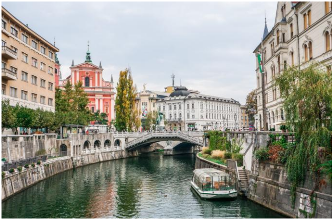
Slowenië se hoofstad, Ljubljana

▶ Ons gaan verseker vir ons groep 'n privaat ekskursie reël: eers na die besondere Postojna Grotte . Dié grotte is meer as twee miljoen jaar oud en dit is die grootste grot-formasie in Europa..En daarna na Ljubljana , Slowenië se statige hoofstad.