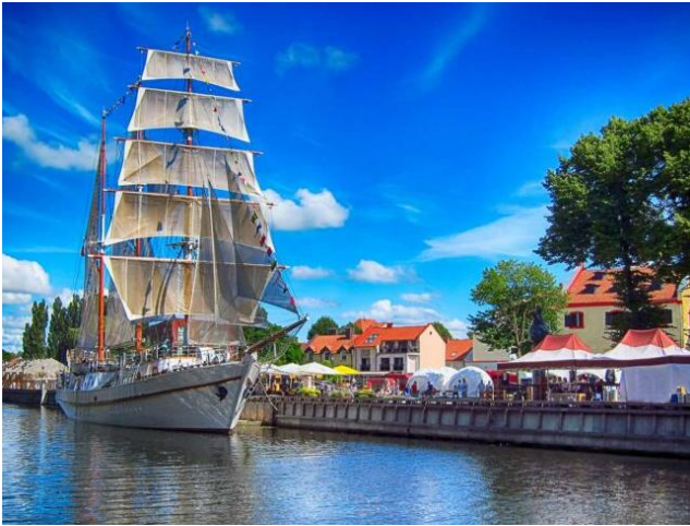
Klaipeda in Lithuanië

18:00: 'n Gesamentlike aandete is vir ons groep bespreek in die Azura Restaurant (dek 6).