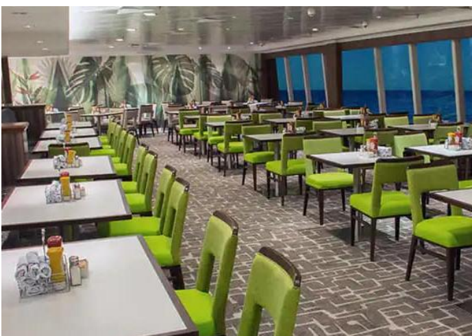
Garden Cafe Buffet