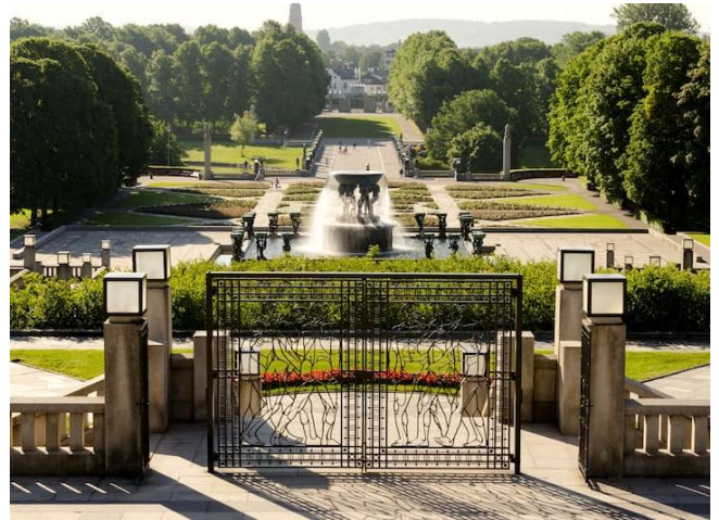
Oslo's Vigeland Sculpture Park