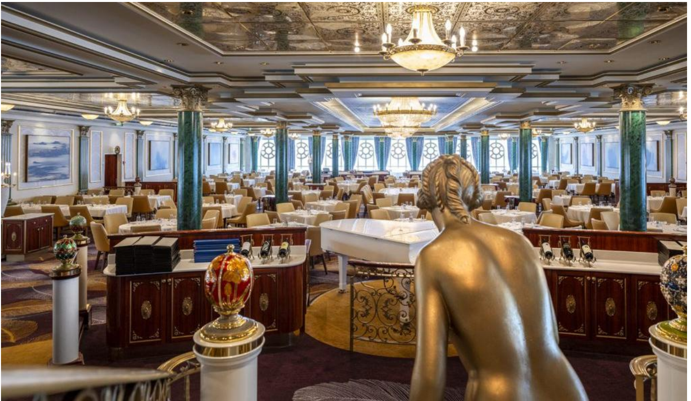
Norwegian Jewel's Tsar's Palace Restaurant