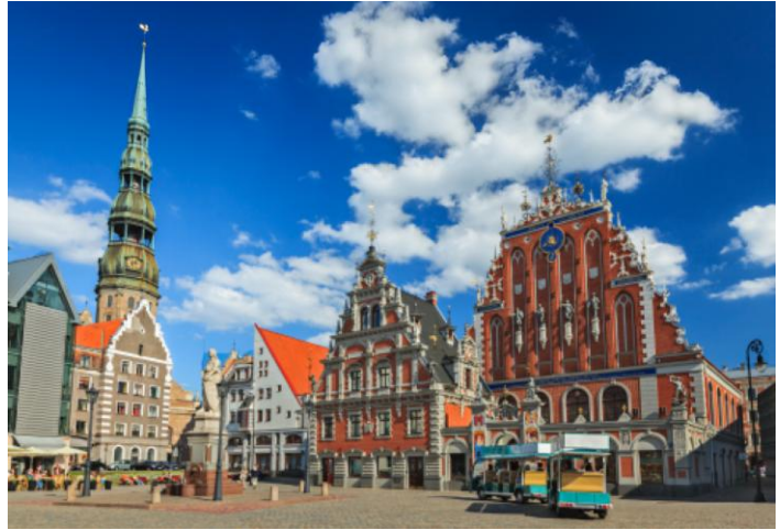
Riga se interessante argitektuur