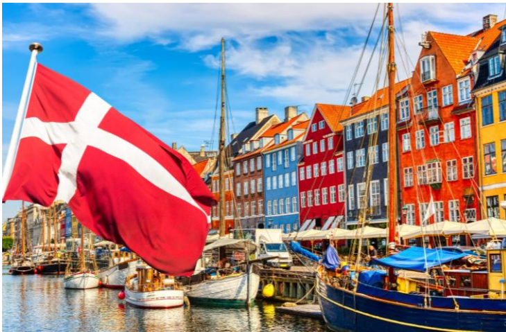
Kopenhagen se Nyhavn