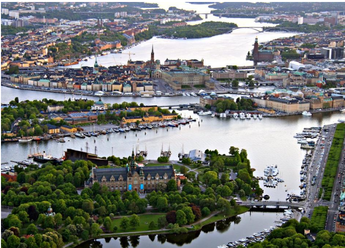
'n Skilderagtige deel van Stockholm, Swede se hoofstad

'n Billike manier om Stockholm te verken is met die Hop On/Hop Off-bus teen ongeveer R570 vir 'n een-dag kaartjie.