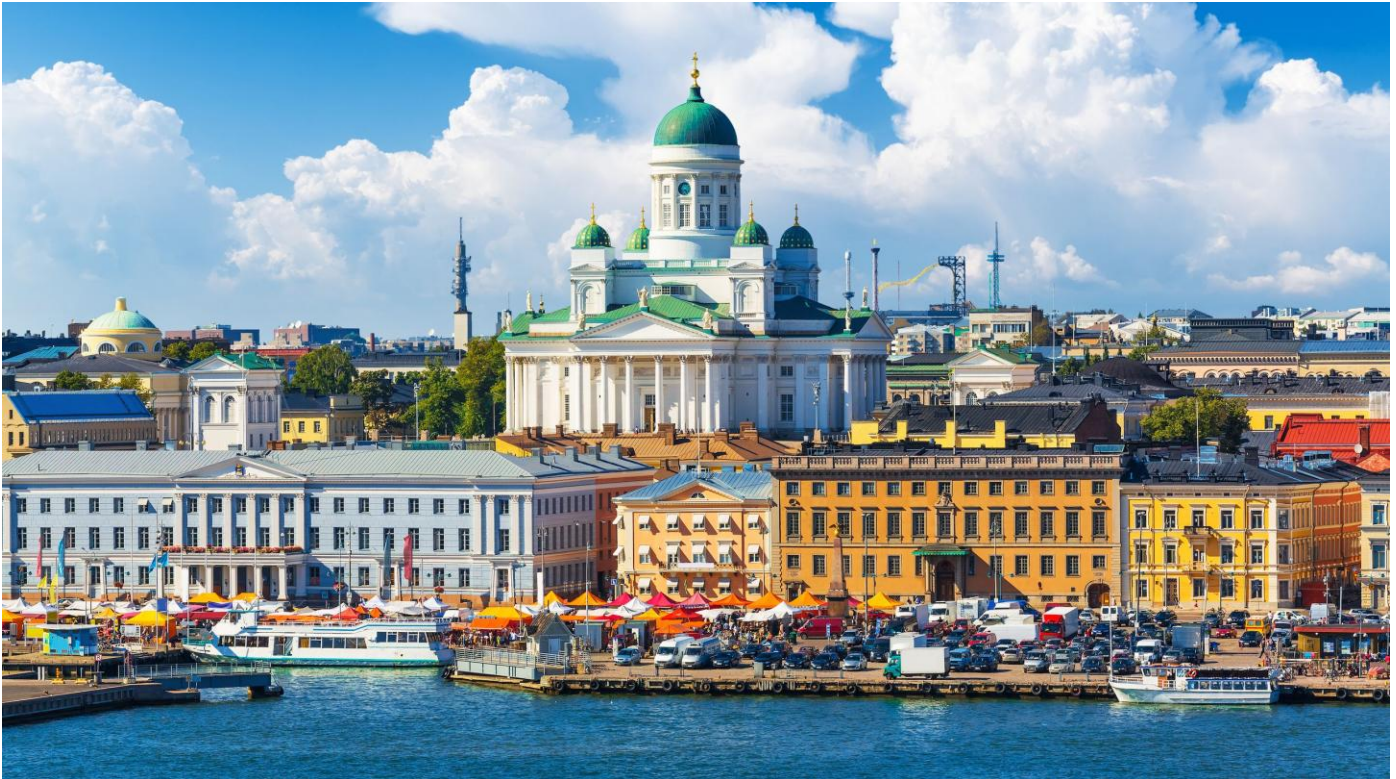
Ons Baltiese Bootvaart-toer eindig in Helsinki , Finland se hoofstad

Na 'n vroeë ontbyt en 'n wonderlike belewenis in nege Skandinawiese lande met ons bootvaart deur die Baltiese See , land ons in Johannesburg en Kaapstad.