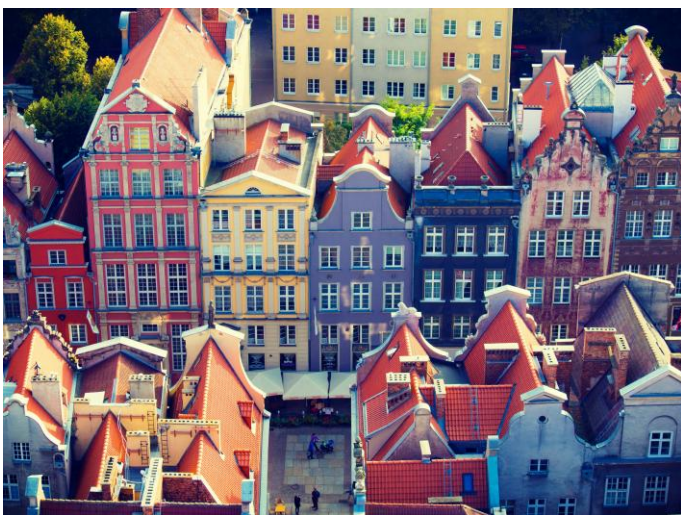
Gdansk is een van die geheime om te ontdek langs die Baltiese See!