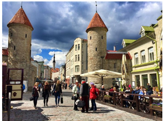
Prentjiemooi Tallinn, hoofstad van Estonia