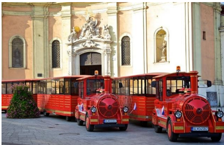
'n "Mini train tour" van Bratislava...