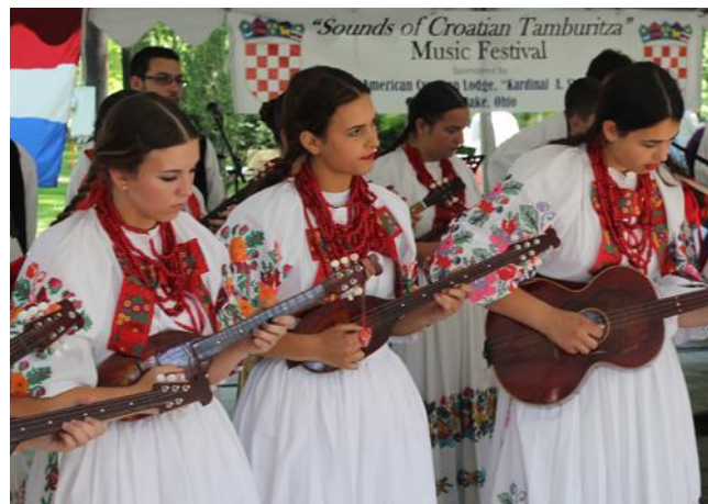
Luister hoe klink Tamburica volksmusiek!