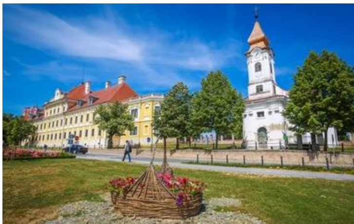
Vukovar is Kroasië se Donau-rivier hawestad