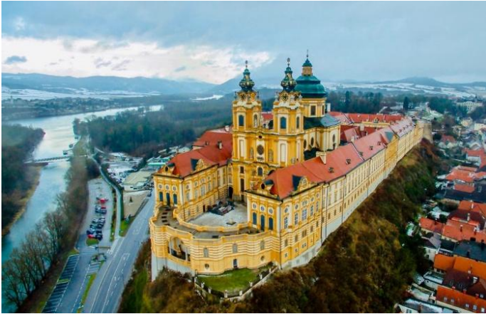
Melk se indrukwekkende Abdy