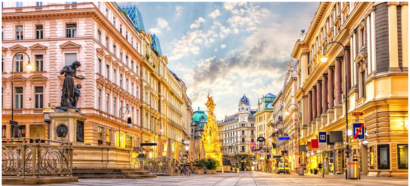
Kom stap saam in Wene se magiese strate...