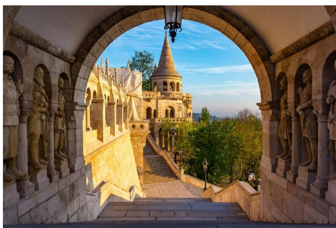
Die Fisherman's Bastion in Budapest