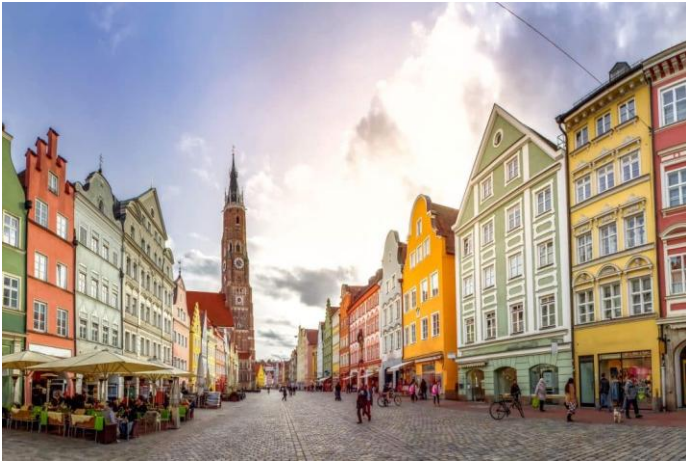
Landshut se Altstadt is sowat 70km vanaf München geleë

Nadat ons in München geland het, reis ons per bus na die MS Vivienne . Op pad na Passau , stop ons eers vir 'n uur by die Landshut (ongeveer 70 km vanaf München) se mooie ou stad.