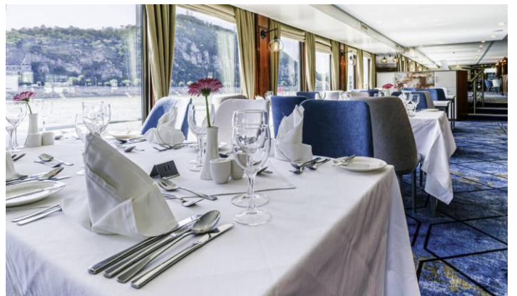
Aanboord die netjiese MS Vivienne