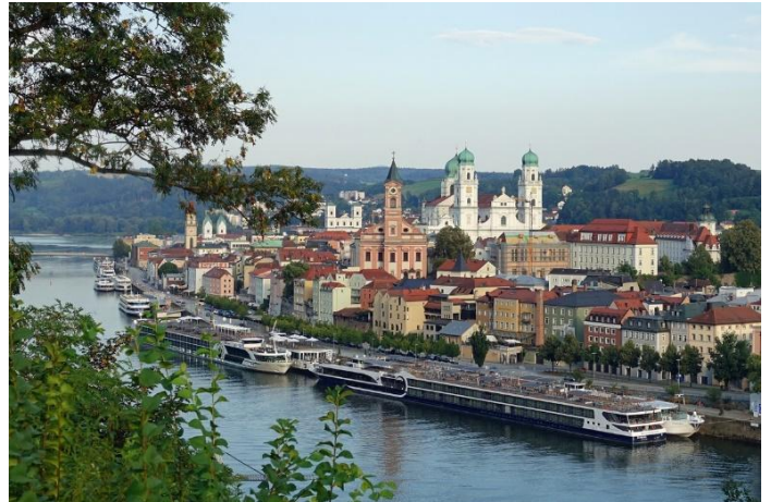
Passau langs die Donau-rivier

As ons in Passau aankom by die MS Vivienne , sal die kaptein en bemanning ons aanboord verwelkom met iets te drink. 17:00 Die MS Vivienne vertrek vanaf Passau en ons Donau-riviervaart begin amptelik! Sit terug in jou kajuit, die gesellige sitkamer, of op die bo-dek en geniet die landskaptonele waarby ons verbyvaar. Vanaand sit ons aan vir 'n spesiale vyf-gang verwelkomings-aandete!