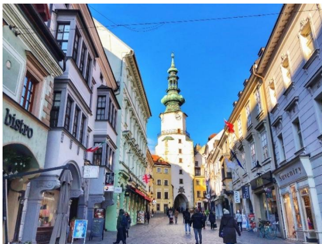
Bratislava se ou stad