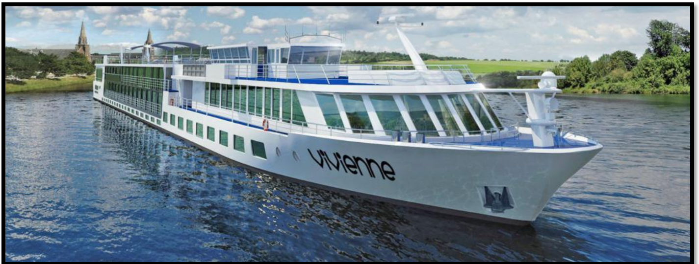
Ons gaan aanboord die elegante MS Vivienne vir ons tien dae Oos-Europese Riviervaart!

As ons in Passau aankom by die MS Vivienne , sal die kaptein en bemanning ons aanboord verwelkom met iets te drink. 17:00 Die MS Vivienne vertrek vanaf Passau en ons Donau-riviervaart begin amptelik! Sit terug in jou kajuit, die gesellige sitkamer, of op die bo-dek en geniet die landskaptonele waarby ons verbyvaar. Vanaand sit ons aan vir 'n spesiale vyf-gang verwelkomings-aandete!