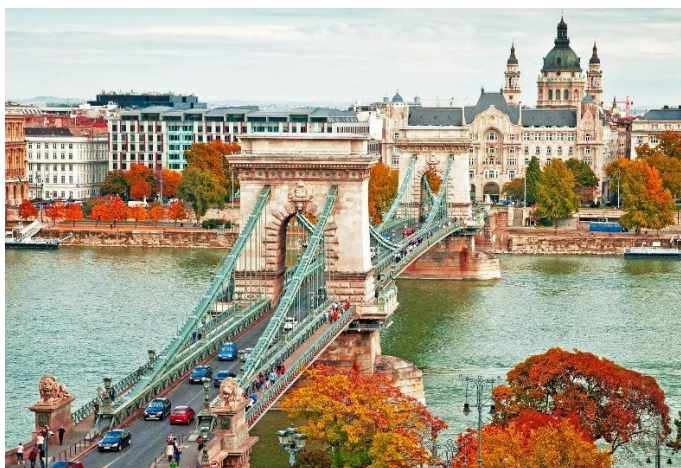
Budapest in die Herfstyd

Na ontbyt vertrek ons met 'n bus na die middestad vir 'n staptoer met 'n plaaslike toergids.