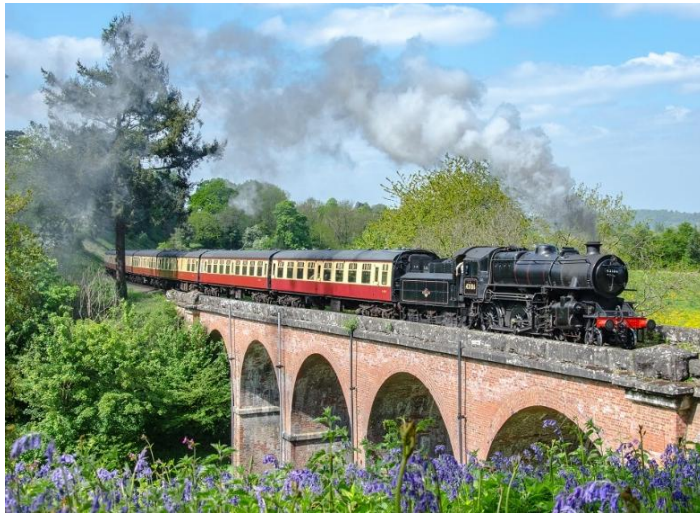
So ry die Seven Valley Steam Railway trein...

Teen ongeveer 16:00 keer ons terug na ons hotel vir aandete.