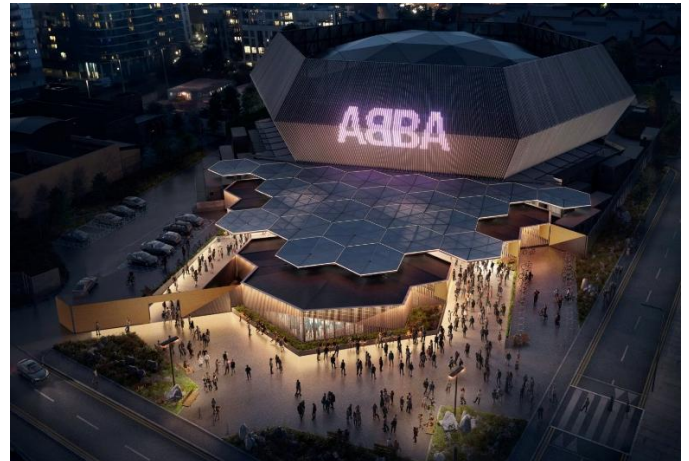
♪ Kom saam na die unieke ABBA ARENA ♪