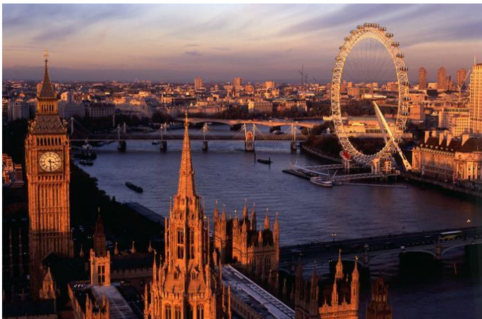
Sien Londen se bakens vanuit die London Eye

Vroegmiddag vertrek ons bus na die Britannia Hampstead Hotel , waar ons die volgende twee nagte oorbly. Ons het vanmiddag tyd om die Camden Market (net 'n entjie se stap vanaf ons hotel) te verken. Die Camden Market is een van Londen se gewildste besoekpunte, met meer as 10 miljoen besoekers per jaar! Die naaste moltreinstasie aan die hotel is die Chalk Farm underground station . Aandete om 19:00 in ons hotel.