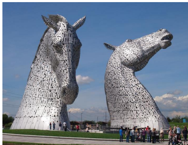
Die Kelpies-beelde in Helix Park