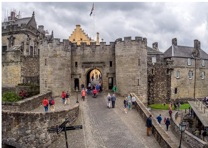
Die Stirling-kasteel in Skotland