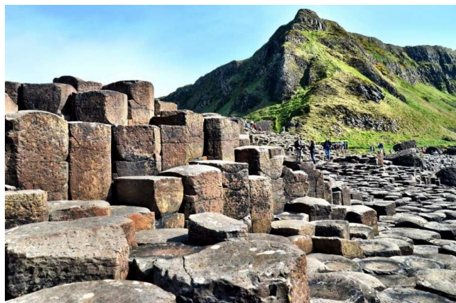
Giant's Causeway in Noord-Ierland