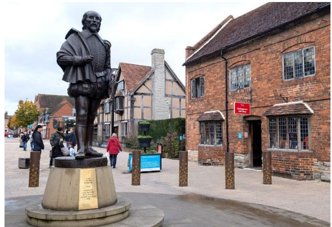
Leer ken William Shakespeare beter in die rustige Stratford upon Avon