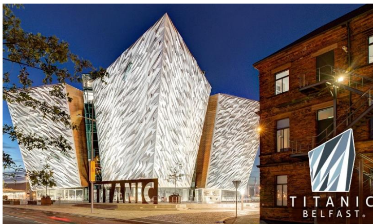
Die Titanic Belfast