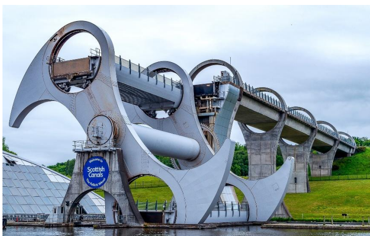
Ons ry op Skotland se Falkirk Wheel

Vanoggend vertrek ons na die Helix Park , om die besondere Kelpies-beelde (wat 30 meter hoog is) te sien. Daarna besoek ons Stirling , met sy middeleeuse ou stad, geleë in sentrale Skotland. Stirling was voorheen die hoofstad van Skotland en word visueel gedomineer deur sy indrukwekkende Kasteel (toegangsgelde ingesluit). Daar sal ook tyd wees om Stirling verder te verken. Vanmiddag beleef ons 'n baie besondere rit op die Falkirk Wheel (toegangsgelde ingesluit).