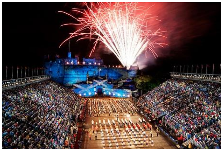
🎵 Beleef die Royal Edinburgh Military Tattoo skouspel! 🎵