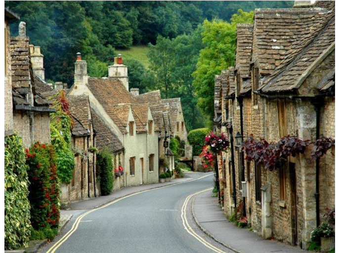
Die prentjiemooi Cotswolds in Engeland