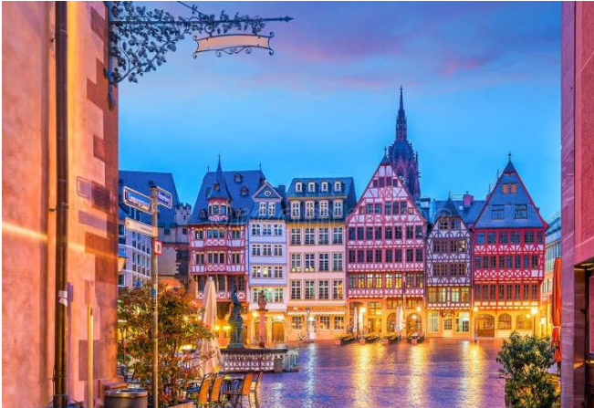
Römerberg, die kleurvolste stadsplein in Frankfurt