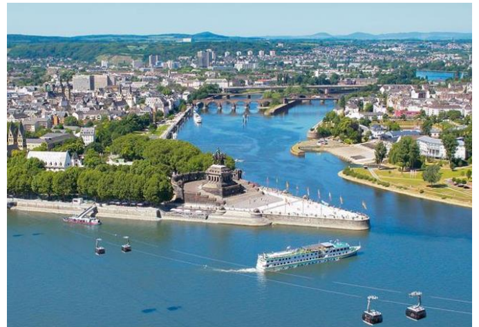
Koblenz, waar die Ryn- en Moeselriviere ontmoet