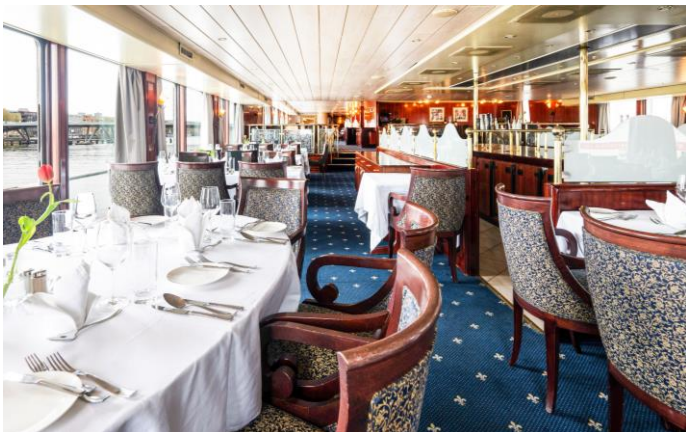
Aanboord die netjiese M/S Aurora