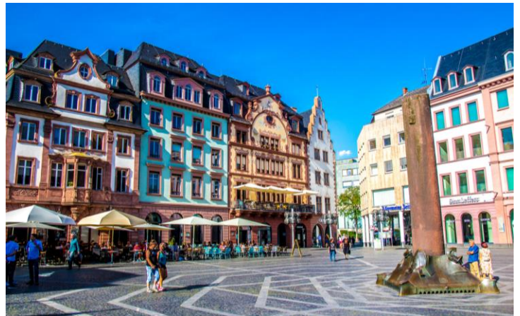
Kom stap saam in Mainz se strate