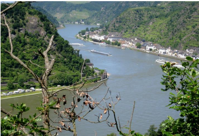
Rhine river bend by the Lorelei cliff