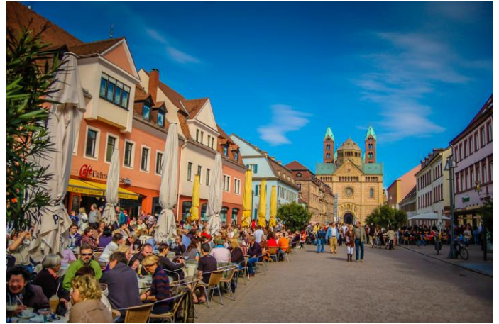
Geniet Speyer se stadsplein