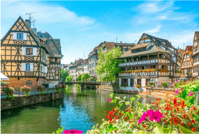
Strasbourg in Frankryk

21:00 Ons boot vertrek vanaf Strasbourg terug oor die grens na Duitsland.