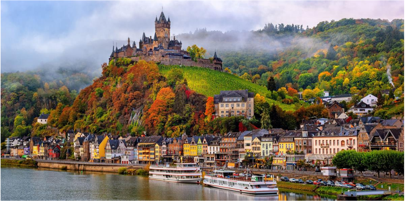
Cochem is een van die verrassings-juwele langs die Ryn