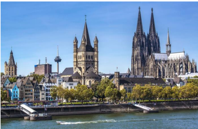
Keulen, met sy Gotiese Domkerk

Vanaand sit ons aan by die Captain's Gala Farewell dinner , met 'n spesiale opgegradeerde vyfgang-maaltyd.