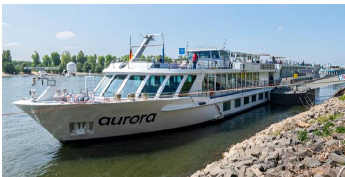
Ons gaan aanboord die M/S Aurora vir ons agt dae Rynvaart!

19:00 Ons boot vertrek vanaf Mainz en ons Rynvaart begin amptelik!