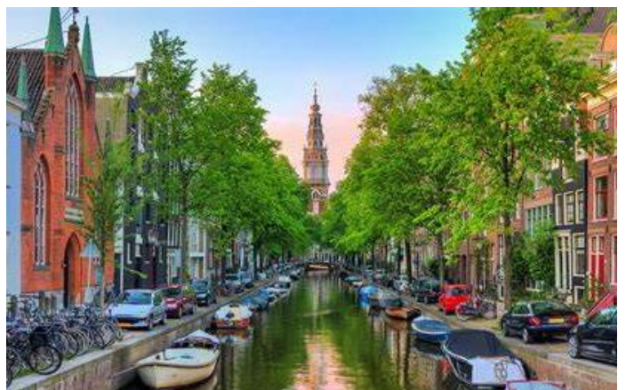
Beleef Amsterdam se kanale