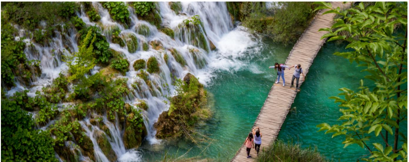
Die skilderagtige Plitvice-watervalle

Aandete en oornag in die Big House Hotel in die Plitvice-omgewing.