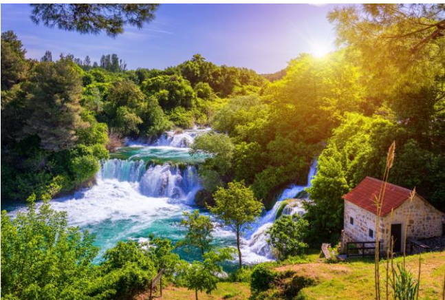
Die Krka Nasionale Park

Vanmiddag reis ons verder noordwaarts langs die kus na Opatija , wat bestempel word as die mees elegante kusoord van Kroasië. Ons bly die volgende drie nagte oor in die Istra Hotel . Aandete in ons hotel om 19:00.