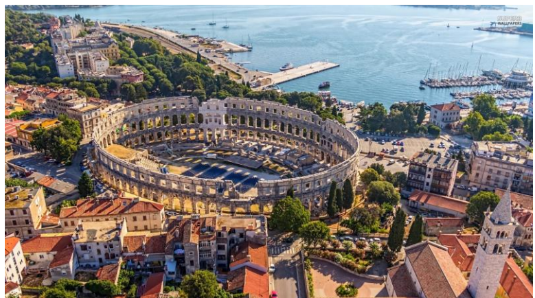
Die Romeinse Amfiteater in Pula