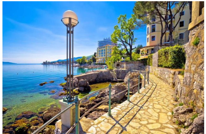
Stap 'n ent op Opatija se promenade!