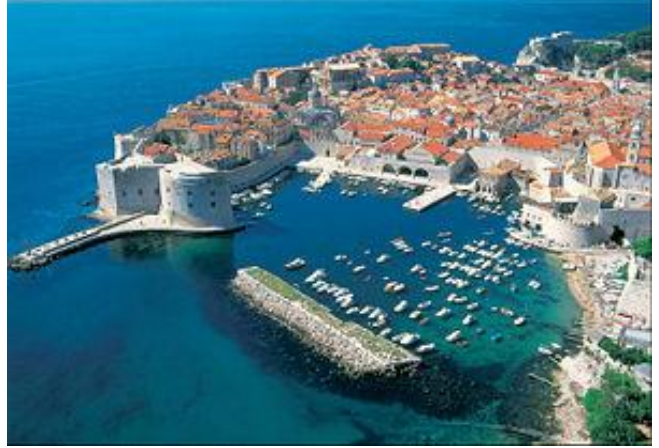
Dubrovnik, pêrel van die Adriatiese See