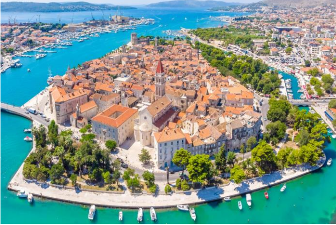
Die Middeleeuse dorp Trogir

Na ons besigtigingstoer en vrye tyd vertrek ons met 'n privaat boot na die pragtige hawedorp Cavtat . Die vaart van sowat 15km verby verskeie eilande is 'n besondere ervaring. Na vrye tyd by Cavtat keer ons weer per boot terug na Dubrovnik. Vir diegene wat in die Mediterreense see wil swem, is daar 'n mooi strand net langs die ou stad. Die seewater in Kroasië is kristal-helder! Aandete in ons hotel.