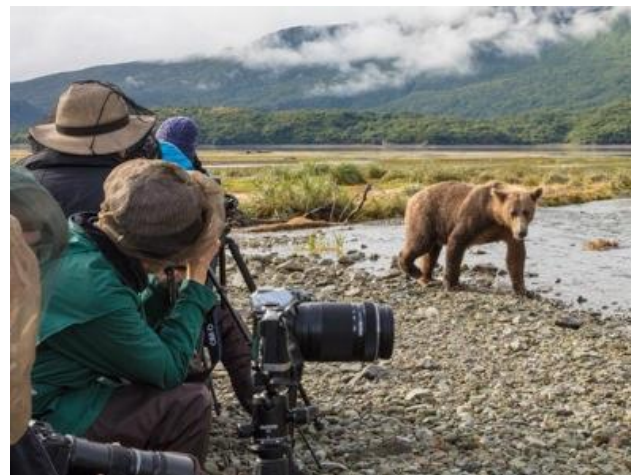
Met meer as 3 500 Kodiak Bruin Bere in die area, is Kodiak die beste plek vir bruin beer besigtiging!