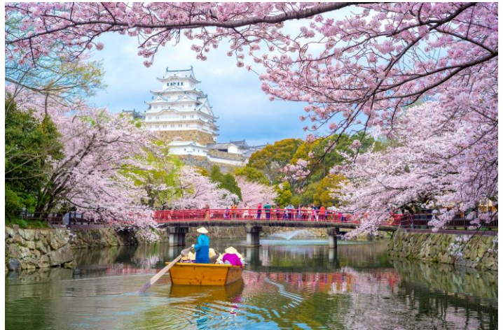
Beleef die Kersie-bloeisel skouspel in Japan se lentetyd