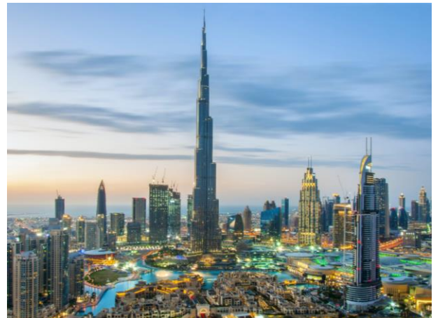
Dubai is die hoofstad van die Verenigde Arabiese Emirate en Aprilmaand is een van die beste maande van die jaar om die stad te besoek.