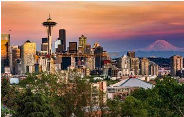
Seattle is die grootste stad in die Washington-staat, met 'n bevolking van ongeveer 740 000

Na ontbyt het ons 'n laaste paar uur in Seattle! Die interessante Museum of Flight is ongeveer 12 minute per taxi vanaf ons hotel vir diegene wat daarin belangstel. Laatoggend moet ons die hotel se shuttle -bussie na die lughawe gebruik, vir ons middagvlug na Dubai.