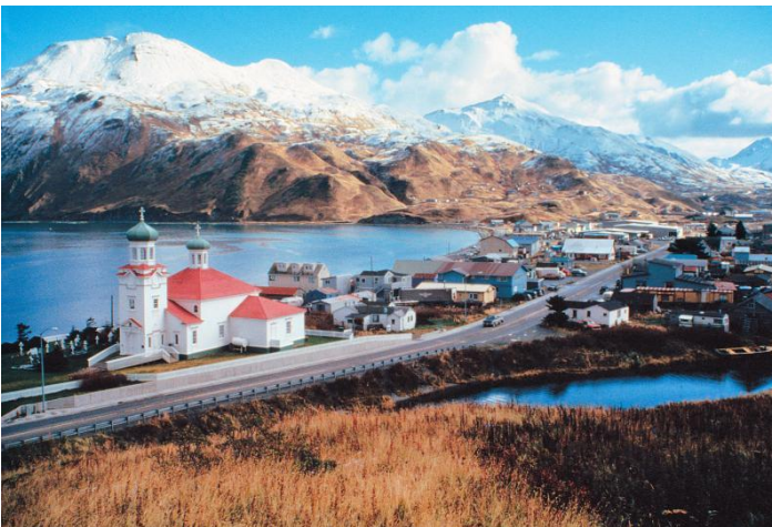
Dutch Harbor op die Amaknak-eiland