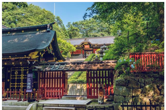
Sendai is die grootste stad in Japan se Tohoku-streek, met nagenoeg een miljoen inwoners