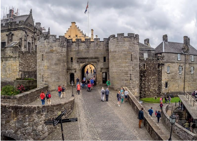
Die Stirling-kasteel in Skotland

Vanoggend vertrek ons na Loch Lomond (die Britse Eilande se grootste meer), vir ons bootvaart op die meer om 10:30 (toegangsgelde ingesluit). Vroegmiddag besoek ons die dorp Stirling , met sy middeleeuse ou stad, geleë in sentrale Skotland. Stirling was voorheen die hoofstad van Skotland en word visueel gedomineer deur sy indrukwekkende Kasteel (toegangsgelde ingesluit). Voordat ons terugkeer na ons hotel, besoek ons die tradisionele Tullibardane Distillery vir 'n toer en die geleentheid om ware Skotse whiskey te proel.