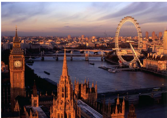
Sien Londen se bakens vanuit die London Eye

Ons reis verder na die historiese dorpie Market Bosworth , waar ons die volgende drie nagte oorbly in die Bosworth Hall Hotel & Spa . Die hotel (met 'n binneshuise swembad) is geleë in die hartjie van die Engelse platteland en omring deur pragtige tuine. Die imponerende hoofgebou dateer uit die sewentiende eeu. Die interessante dorp is net 'n entjie se stap vanaf die hotel. Aandete om 19:00.