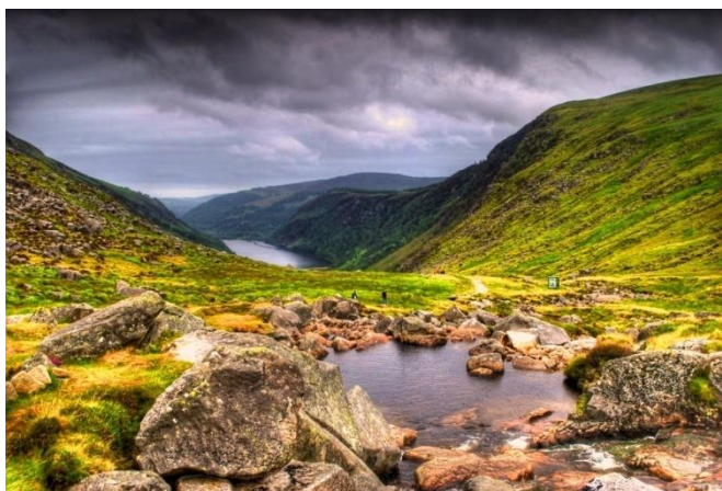
Die natuurskone Wicklow-berge in Ierland