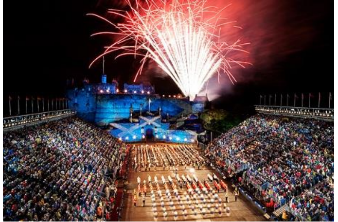
Beleef die Royal Edinburgh Military Tattoo skouspel!