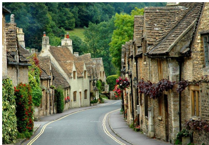
Die prentjiemooi Cotswolds in Engeland