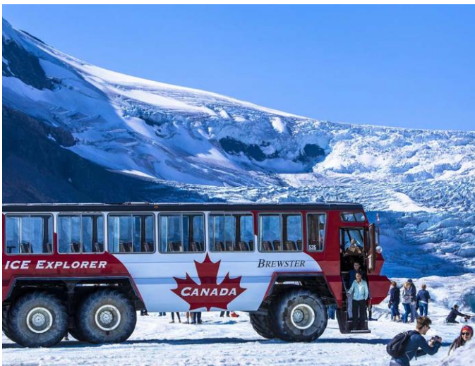
Ry saam op die Ice Explorer in die Jasper Nasionale Park