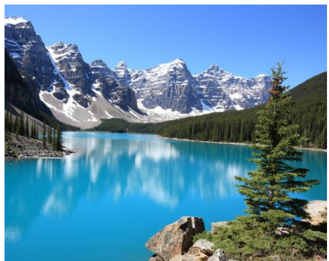
Die mooie Lake Louise in die Banff Nasionale Park