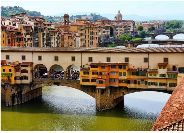
Stap saam oor die Ponte Vecchio in Florence