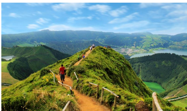
Ponto Delgado, Azores, Portugal