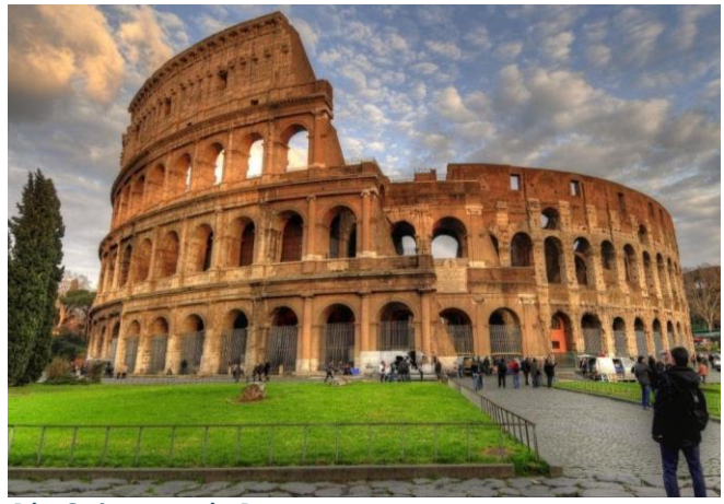
Die Colosseum in Rome